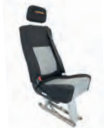
Flexus2 Contour 430 mm